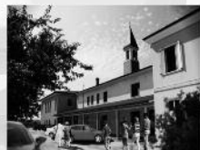
VISTE LATO EST