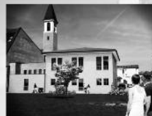
VISTE LATO SUD